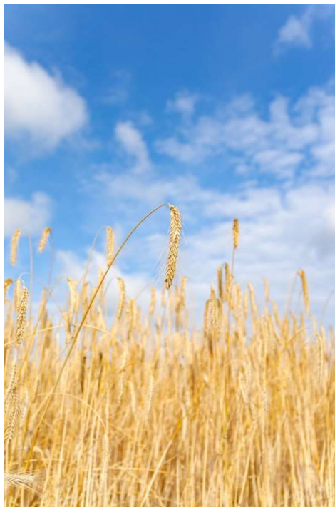
N. Schwarz © GemeindebriefDruckerei.de

Widmen wir uns in dieser Zeit diesem Thema und lassen wir uns ganz bewusst darauf ein. Wir hoffen auf viele Interessierte aus unserer Pfarreiengemeinschaft und freuen uns auf Sie!