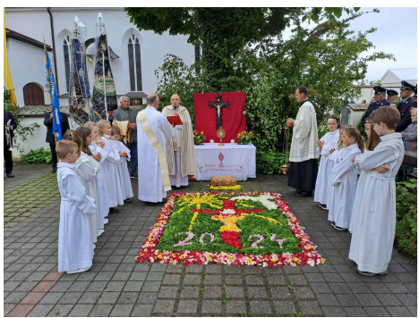
Bettina Simmel: Altar mit Blumenteppich in Reibersdorf